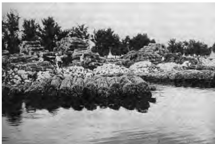
Regi Lagni. Vasche per il macero della canapa

Veniva, invece, definita sfatta , quando il processo di macerazione era andato oltre i limiti normali.