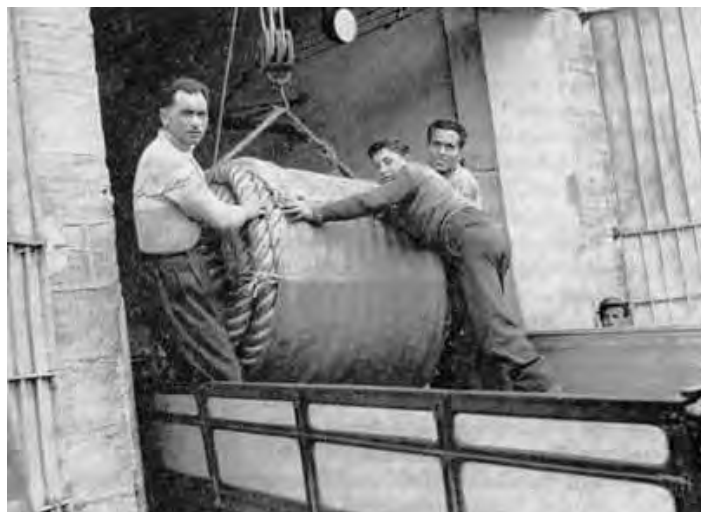
Sistemazione di rotoli di corde di canapa

In teoria l'esercizio si sarebbe dovuto chiudere automaticamente in pareggio, ma in effetti non era così per i notevoli ritardi che si verificavano; le vendite non venivano realizzate nei tempi ristretti che sarebbero stati necessari; molto spesso era proprio il C.I.P. che, evidentemente per le molte pressioni, indugiava non poco prima di fissare il prezzo; ne derivava un'incidenza notevole degli interessi passivi sui costi di gestione, i quali si riflettevano tutti negativamente sull'economia del settore canapiero, in quanto il Consorzio, fungendo semplicemente da intermediario, non subiva alcuna alea. L'assurdo era tutto qui, nel funzionamento di questa azienda, che la legge aveva imposta senza dotarla di un proprio fondo patrimoniale e che operava esclusivamente con denaro preso a prestito, per l'ammontare di vari miliardi, il che contribuiva non poco a determinare un notevole onere che, in definitiva, si ripercuoteva sui canapicoltori.