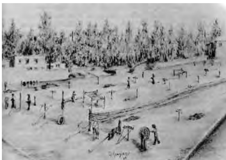
La canapa nell'Arte. Filatoie (Disegno dal vero del Prof. Franco Graziano)

Il valore del prodotto è dunque, anche nel caso di una produzione media buona, di lire 34.080, mentre le spese, calcolate su salari piuttosto bassi, sono di lire 41.750. Chi paga le 7670 lire che rimangono di passivo? Non certo l'agrario, il quale esige l'affitto in base al contratto e cioè due fasci e mezzo per moggio".