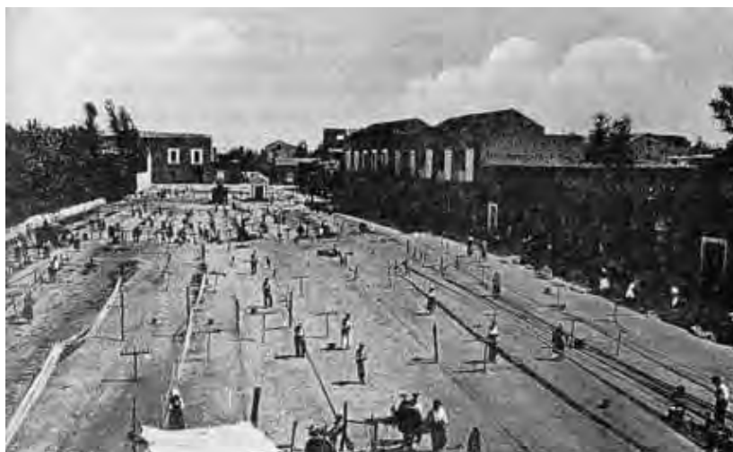
Le filatoie che si trovavano nell'ampio spazio ove sorgeva l'edicola della Madonna di Casaluce, in Frattamaggiore

Il R. D. L. 18 agosto 1941, n. 969, istituiva l' Ente Nazionale Esportazione Canapa , al quale era demandato il compito dell'esportazione della canapa, sotto la vigilanza governativa, nei limiti del contingente determinato dall'Ente preposto all'ammasso. La Legge 18 maggio 1942, n. 566, istituiva l' Ente Economico delle fibre tessili , nel quadro di una revisione dei vari Enti preposti all'economia agricola; al nuovo Ente erano assegnate le competenze sulla canapa, sul lino, sul cotone, sulla bachicoltura. E' evidente che, se i provvedimenti italiani adottati dal 1933 al 1938 vollero cercare di arginare le conseguenze disastrose della crisi, introducendo misure protettive sulla scia di quanto fatto altrove, quelli successivi, dal 1940 in poi, furono dettati da esigenze belliche e miravano ad assicurare a noi ed ai tedeschi la piena disponibilità di un prodotto al momento di primaria importanza.