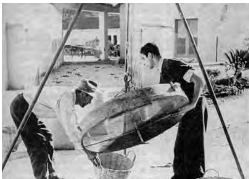
Cernita del seme di canapa

All'epoca della fioritura, le piante maschili venivano estirpate dopo la dispersione del polline. Rimanevano le piante femminili, fino alla completa maturazione del seme. Le piante maschili, estirpate a fioritura avvenuta, avevano nel sementaio uno sviluppo maggiore di quelle derivanti dalla seminazione normale, dato il carattere della coltura rada che permetteva uno sviluppo maggiore. Questo tipo di canapa per la ritardata estirpazione e per lo sviluppo accentuato, veniva chiamato nella campagna scigliatura . La fibra era grossolana, ruvida ed in parte anche sensibilmente lignificata al piede. La cima era normalmente arida.