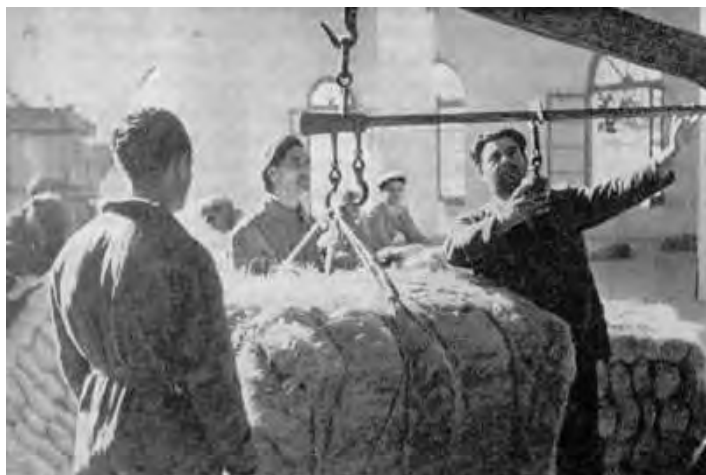
Pesatura balle di canapa greggia

Certamente un tale stato di cose desta oggi perplessità profonde, ma bisogna inquadrarlo nella mentalità del tempo, in un modo di vivere entrato profondamente nel costume attraverso i secoli e che aveva dato vita ad usi e tradizioni ancora oggi non spente, oltre ad una sorta di specializzazione che tornava a vanto dei nostri Comuni: “Per questa industria si adopera, come si adoperò, un metodo di coltivazione, di maturazione, e di maciullazione di canape tanto natio e cotanto particolare, che viene preferito all’istessa canapa di Valenza, e di tutte le province del nostro Regno” 6 .