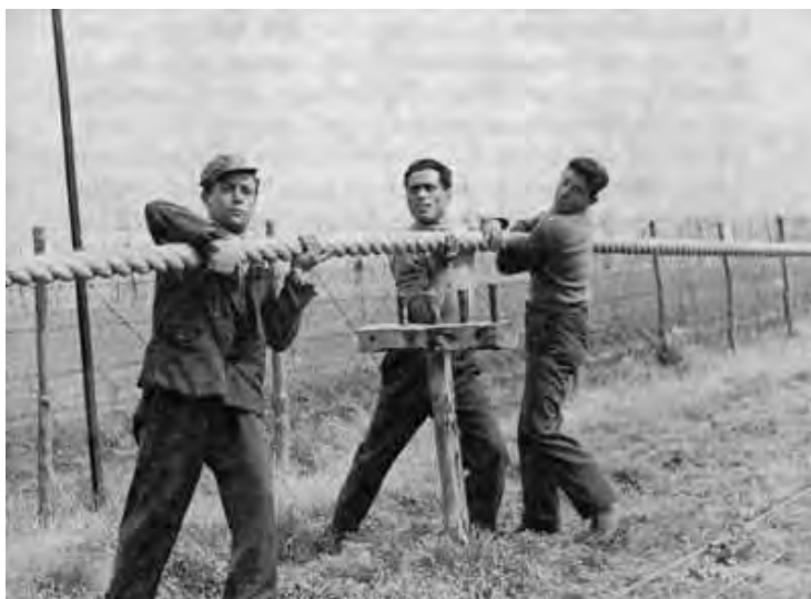
Lavorazione delle corde

Innanzitutto era insorto un pesante conflitto fra l'Opera Nazionale Combattenti e i coloni della zona bonificata del basso Volturno; questi coloni, venti anni prima, avevano ottenuto dall'Opera, in concessione, i terreni; avevano decisamente contribuito alla loro definitiva sistemazione, ma, prima la guerra, poi le alluvioni del 1949 e del 1950, avevano recato danni immensi. Ciò aveva loro impedito di pagare regolarmente le quote annue ed ora l'O.N.C. voleva imporre un nuovo oneroso contratto; di fronte alle proteste degli interessati, aveva dato inizio a tutta una serie di azioni giudiziarie.