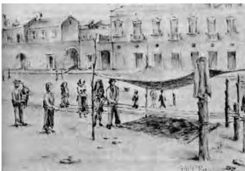
La canapa nell'Arte. Filatoio prospiciente la Chiesa di S. Rocco in Frattamaggiore (Esecuzione grafica del Prof. Franco Graziano)

Deposti gli steli sul pavimento, essi venivano irrorati con acqua la sera ed il giorno successivo potevano essere stigliati a mano. La fibra ricavata per tutta la lunghezza dello stelo aveva generalmente applicazione per la fabbricazione di corde grossolane di uso agricolo.