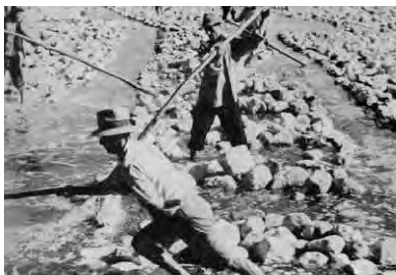
Spostamento di pile di canapa nella vasca di macerazione

Il diametro degli achenii della canapa variavano da mm. 3,2 a mm. 4,5 ed anche, eccezionalmente, 5 mm.; i semi sotto la misura di mm. 3,2 avrebbero dovuto essere esclusi dalla semina. Pare che l'energia germinativa del seme derivi proprio dalla sua grossezza. Il miglior seme era ritenuto quello tondeggiante; meno pregiato quello costoloso. Secondo il Prof. Todaro, il peso per ogni mille semi di canapa avrebbe dovuto aggirarsi fra i 21,5 e 22 grammi 8 .