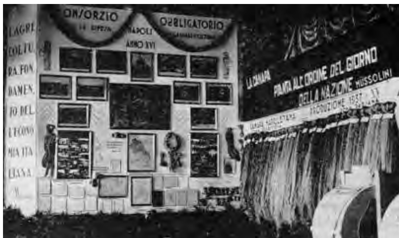
La canapa all'esposizione del 1938. La frase di Mussolini conferma la grande importanza economica che questo tessile aveva allora

Abbiamo già accennato a talune iniziative consortili per ottenere il miglioramento della produzione e la meccanizzazione delle varie fasi della lavorazione. Ma l'azione non fu incisiva e non superò, generalmente, la fase sperimentale. Quando si cercò di accelerare i tempi e di rendere operativi sul piano pratico i risultati raggiunti era ormai troppo tardi. Sta di fatto che, nell'arco trentennale della sua esistenza, il Consorzio aveva curato essenzialmente l'ammasso e la vendita della canapa; una certa cura aveva posto nel campo della genetica, per il miglioramento del seme, con risultati apprezzabili, ma scarsi sul piano quantitativo; i concorsi per nuove apparecchiature idonee ad alleviare e rendere meno costose le varie fasi della lavorazione della canapa avevano dato, come abbiamo visto, buoni risultati, ma era mancata la capacità di introdurre effettivamente queste attrezzature nelle nostre campagne. Compito del Consorzio avrebbe dovuto essere anche quello di promuovere negli operatori della canapa, soprattutto in Campania, lo spirito associativo, che avrebbe favorito l'accettazione di nuovi metodi di coltura e l'introduzione di tecniche e mezzi moderni, ma questo settore fu totalmente ignorato.