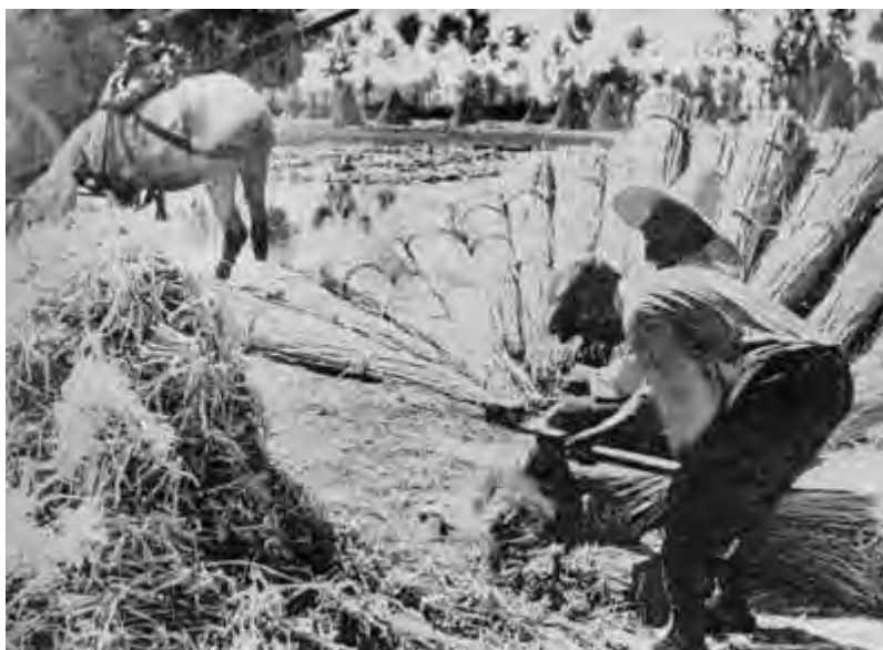
Covoni di canapa per il taglio delle cime e delle radici

Pare che la seminazione fitta rendesse più piante maschili che femminili. Abbiamo già notato che la pianta maschile forniva taglio più pregiato; la pianta femminile era destinata alla formazione del seme e veniva estirpata insieme a quella maschile. Abbiamo già visto che il quantitativo di seme normalmente necessario per ettaro di terreno della Campania si aggirava intorno ai 30 Kg., per seme selezionato e, quindi, di buona purezza ed alta percentuale di germinabilità. Nel Bolognese e nel Ferrarese la semina veniva fatta quasi sempre a macchina, il che rendeva possibile una maggiore regolarità di distribuzione.