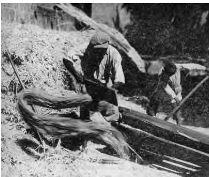
Maciullazione della canapa

In Campania, il 95 % del prodotto veniva trattato a mano. Esso consisteva nel far passare un gruppo di steli macerati, allo stato secco, sotto un apparecchio rudimentale detto maciulla , nel napoletano, o gramola , nel bolognese, di maniera che la stigliatura veniva denominata, nelle rispettive zone, maciullatura o gramolatura .