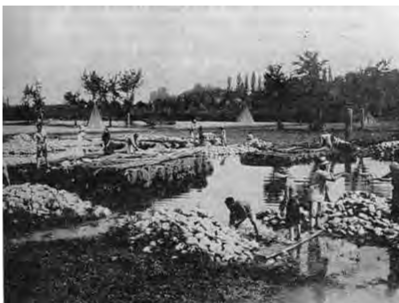
Vasche di acqua per la macerazione della canapa

A questo punto la canapa andava tolta dal macero. Poiché le prove venivano ripetute, se necessario, ad intervalli, si poteva stabilire, con sufficiente approssimazione, il momento giusto per l'estrazione della canapa dal macero, operazione che aveva inizio togliendo le pietre di affondamento. La barca tendeva a sollevarsi man mano che il peso veniva ridotto. I fasci venivano tolti dall'acqua, scuotendoli leggermente; erano poi, trasportati sugli spanditoi ad asciugare, mantenendo una sola legatura verso la parte superiore, per cui il fascio assumeva la caratteristica forma ad X. Tale sistemazione veniva effettuata dagli aiutanti del sorvegliante, mediante gesti rapidi e sicuri. La canapa restava sullo spanditoio fino a totale essiccamento.