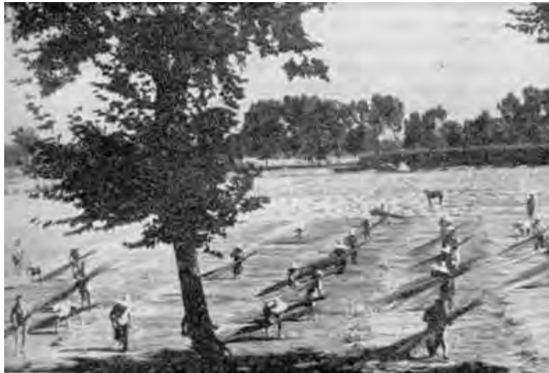
Distesa di canapa al sole per asciugarla

Se il tarlo attaccava le piante femminili, cioè quelle da seme, l’infiorescenza si disseccava e la pianta andava perduta.