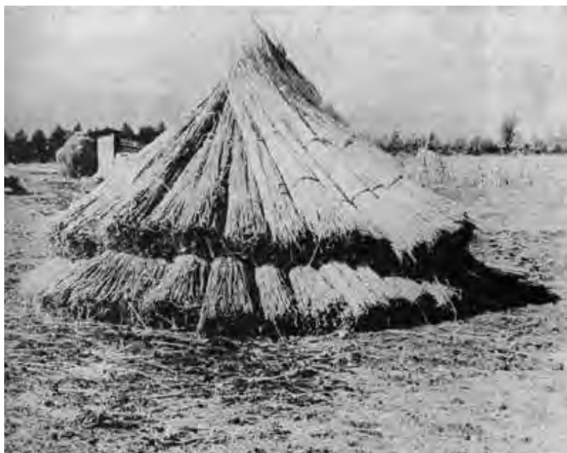
Un tipico ammasso di fasci di canapa

Il senso di religiosità della gente dei campi era altissimo; d'altro canto, essendo il risultato delle dure fatiche legato quasi esclusivamente ad eventi naturali, i contadini trovavano conforto e motivo di fiducia nella fede e legavano tutte le operazioni principali a particolari festività, la semina del pascone avveniva di solito il 15 agosto, giorno dell'Assunta, venerata a Casandrino e dintorni; l'aratura, nel tenimento di Grumo, coincideva con la celebrazione di S. Tammaro; la semina della canapa con la ricorrenza di S. Giuseppe. Particolare devozione era rivolta ai santi patroni della pioggia, i quali, secondo le stagioni, venivano invocati sia per ottenere l'acqua sia per evitarla: così la Madonna di Casaluce, S. Sossio a Frattamaggiore, S. Elpidio a S. Arpino ... ma ogni zona aveva i suoi protettori.