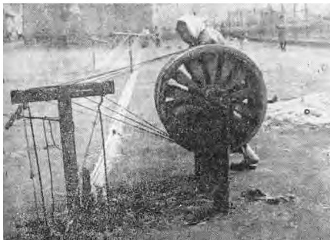
La tipica ruota per fabbricare le funi, un tempo abbondantemente presente nelle filatoie frattesi