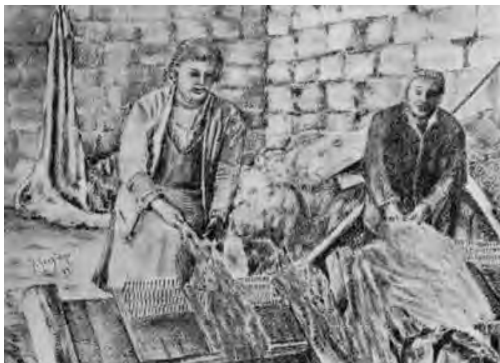
La canapa nell'Arte. Le canapine (Esecuzione grafica del Prof. Franco Graziano)

Da quanto sinora esposto, emerge che fra le molteplici operazioni necessarie alla produzione canapiera, quella della macerazione costituiva non solo la più delicata, ma anche la più onerosa.