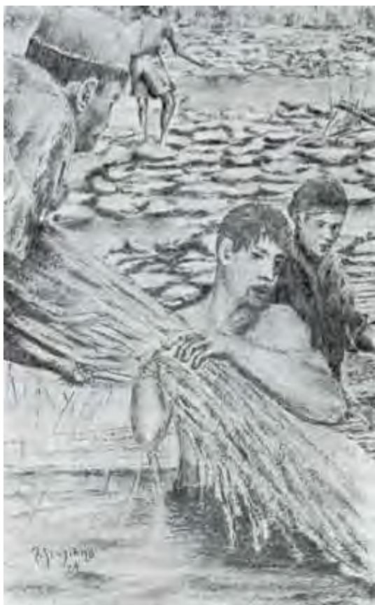
La canapa nell'Arte. Estrazione della canapa dal macero (Esecuzione grafica dei Prof. Franco Graziano)

L'acqua del mare, però, non macera; l'acidità non sale, almeno per la canapa, e l'azione dei batteri quindi è nulla. Lo jodio, oltre la concentrazione salina, deve esserne la causa. Gli agricoltori hanno ritenuto da sempre che le acque fortemente dure non macerino: ciò, però, non è stato provato in controlli di laboratorio. Certamente le acque dure stentano a macerare; anche le acque bicarbonate sono poco raccomandabili. Non così quelle contenenti carbonati, specialmente di calcio, il quale è elemento ritenuto coagulante delle pectine solubili.