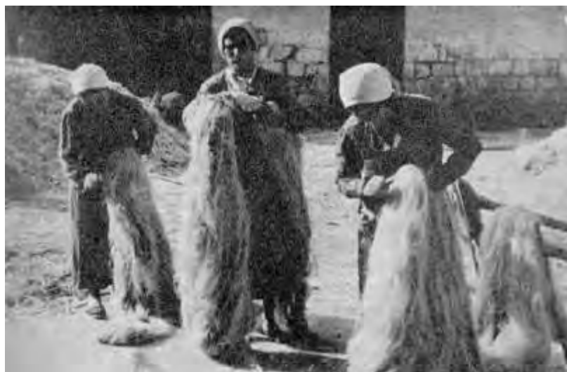
Rifinitura nella lavorazione della canapa greggia

Il fenomeno della prefioritura, si manifestava spesso nei semi acquistati dall'agricoltore e ciò ci induce a pensare che esso era legato anche alla bontà della conservazione: sarebbe stato necessario provvedere, come si, fa per il grano, al controllo della provenienza, del seme all'origine, in modo da non esporre gli agricoltori a danni che talvolta erano veramente ingenti.