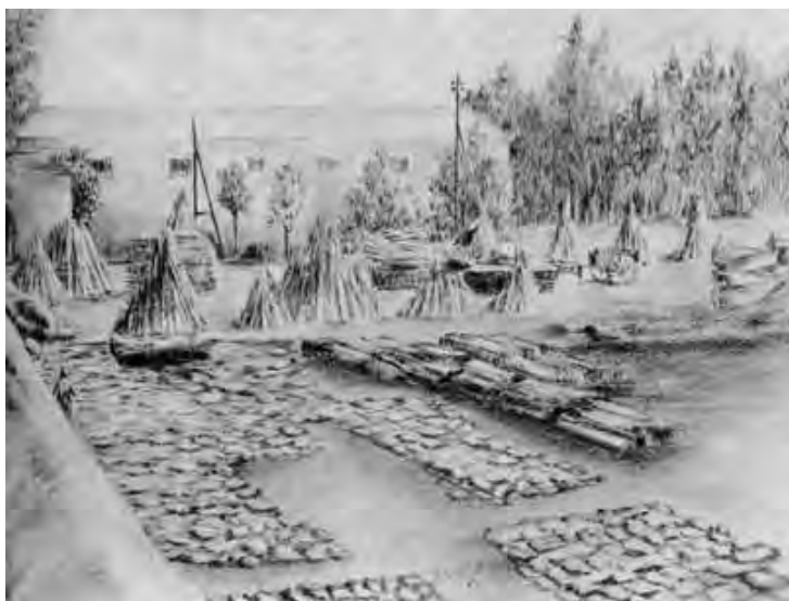
La canapa nell'Arte. Il macero

I competenti riconoscevano soprattutto dal tipico odore la canapa macerata in vasca, la quale aveva decisamente pregi superiori ed era, perciò, più ricercata.